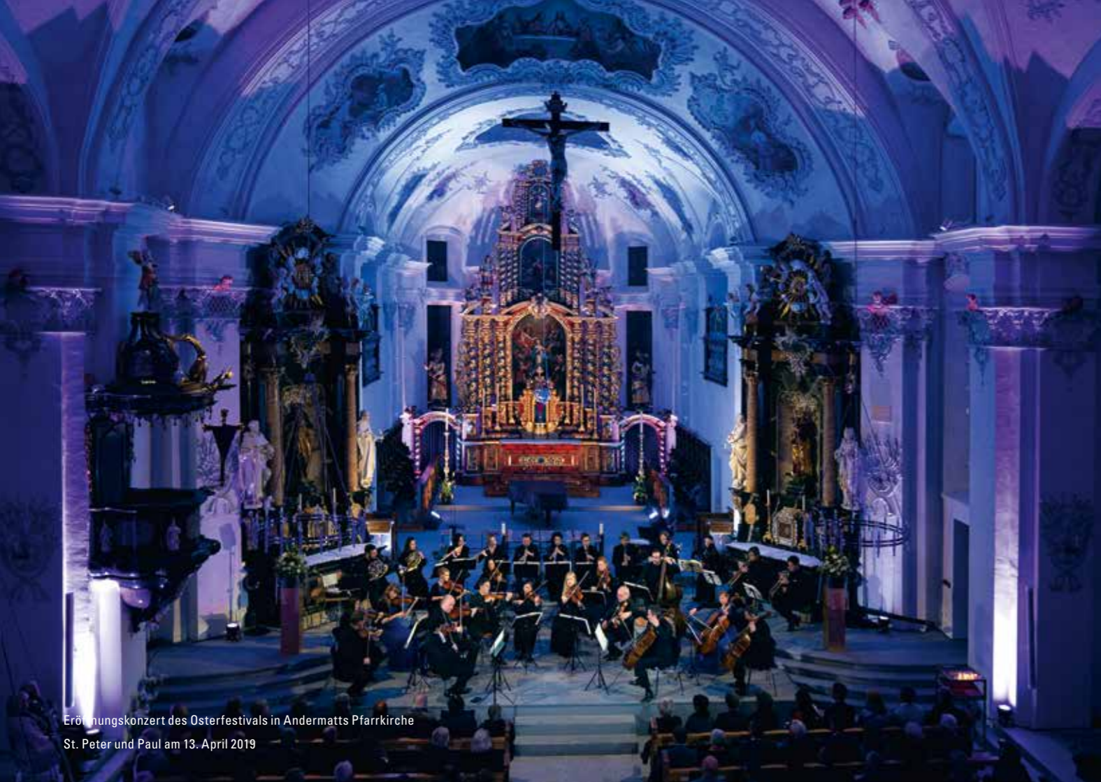
Eröffnungskonzert des Osterfestivals in Andermatts Pfarrkirche St. Peter und Paul am 13. April 2019