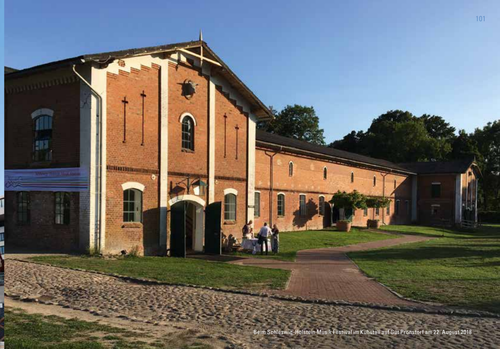
Beim Schleswig-Holstein Musik Festival im Kuhstall auf Gut Pronstorf am 22. August 2018