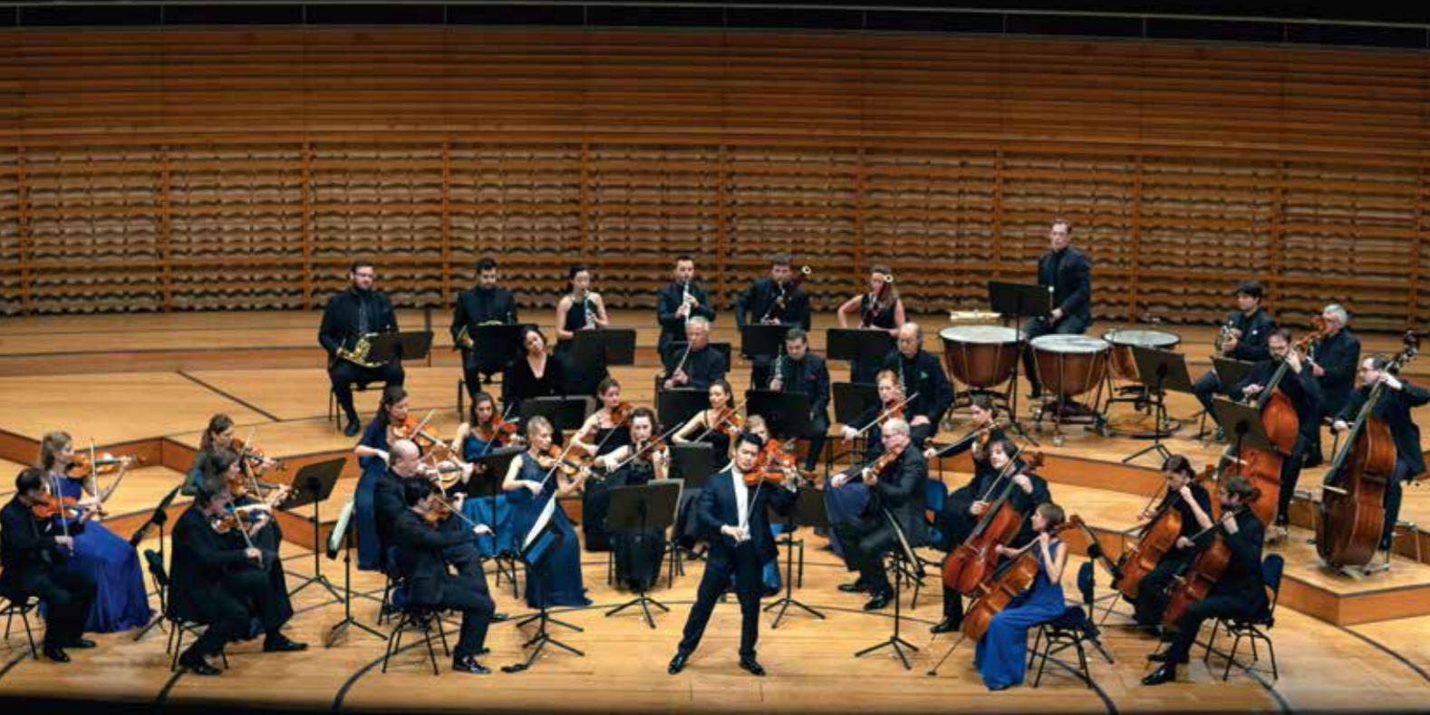
Saisoneröffnung der Konzert Reihe Luzern mit Ray Chen am 3. Dezember 2018