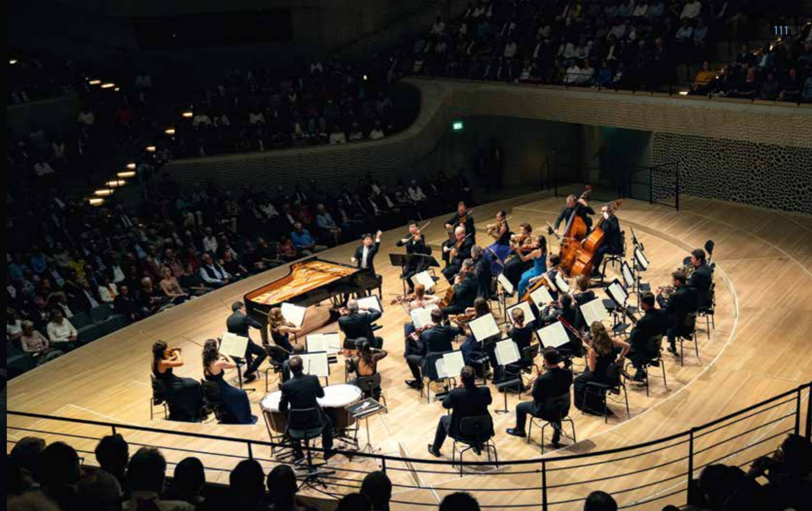
Kit Armstrong und die Festival Strings Lucerne in Mozarts Klavierkonzert KV 482 beim Hamburger Gastspiel am 13. Juni 2019