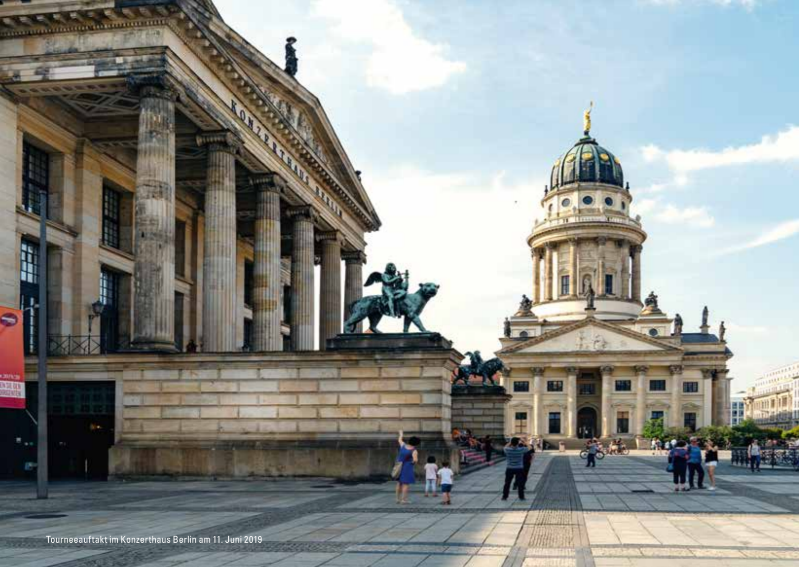
Tourneeauftritt im Konzerthaus Berlin am 11. Juni 2019