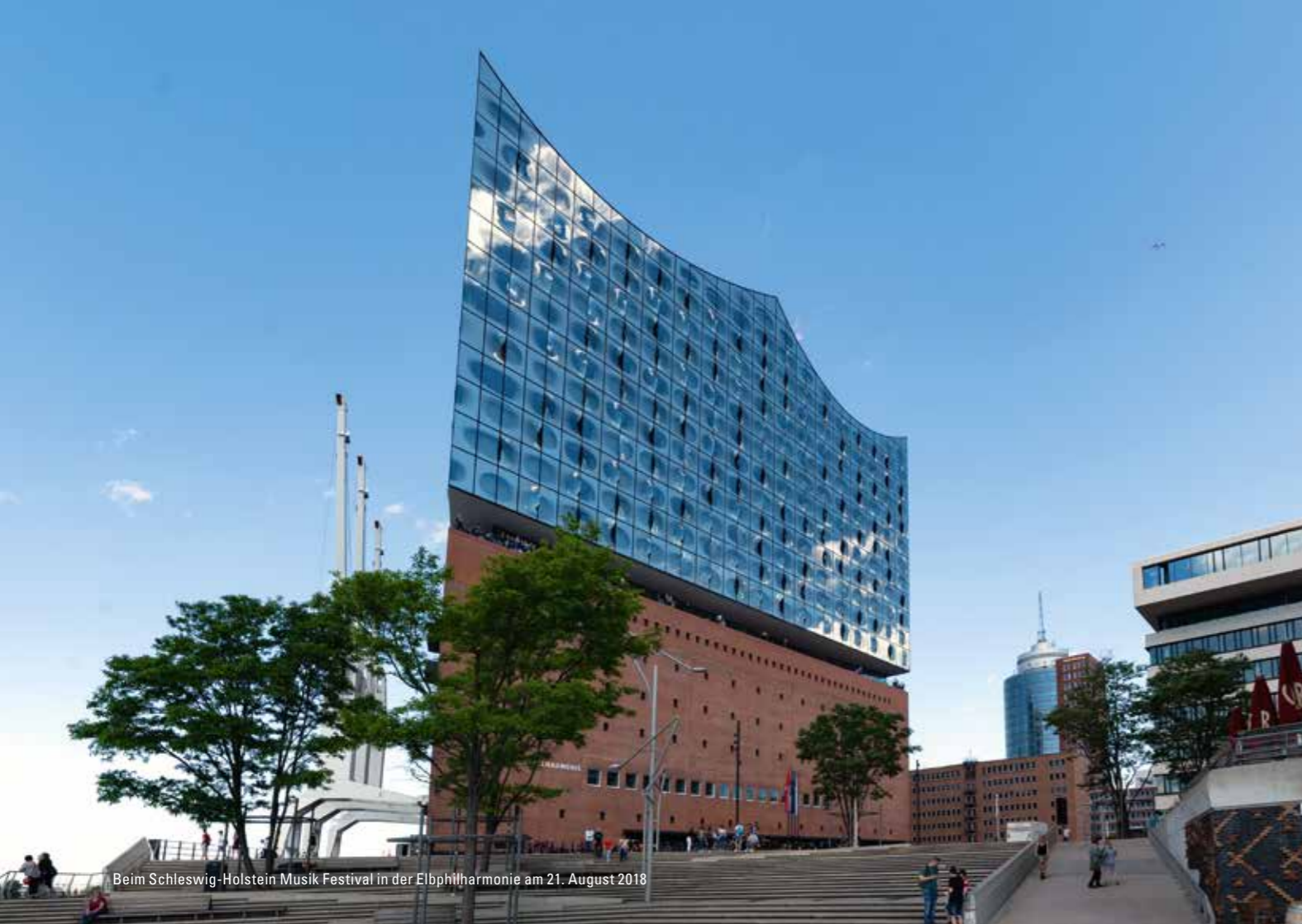
Beim Schleswig-Holstein Musik Festival in der Elbphilharmonie am 21. August 2018