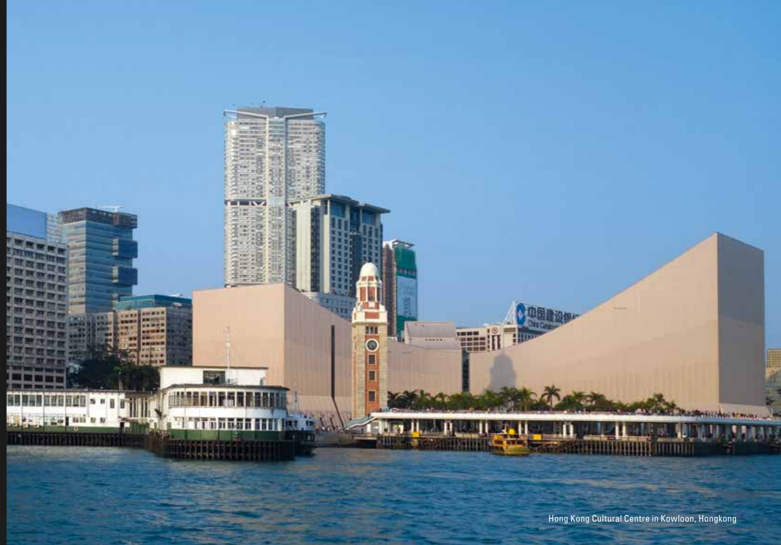
Hong Kong Cultural Centre in Kowloon, Hongkong