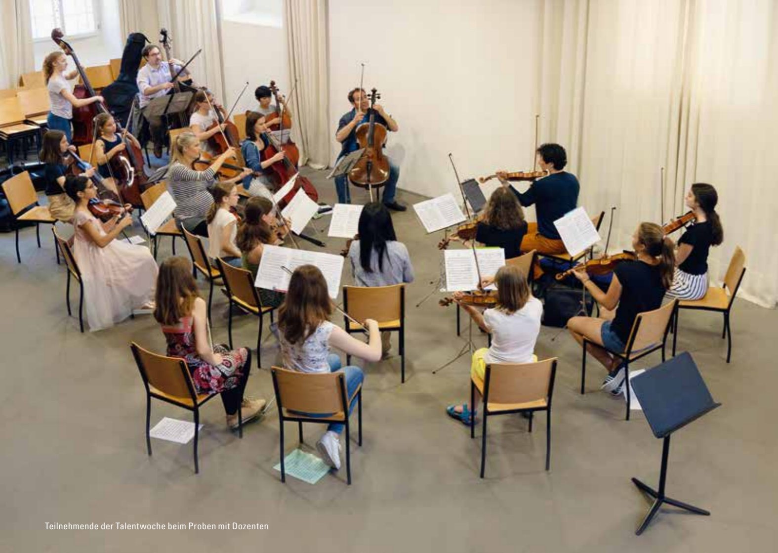
Teilnehmende der Talentwoche beim Proben mit Dozenten

SO 11.08.2019 17.00 UHR ERÖFFNUNGSKONZERT DER DOZIERENDEN MUSIKSCHULE DER STADT LUZERN, GROSSER SAAL