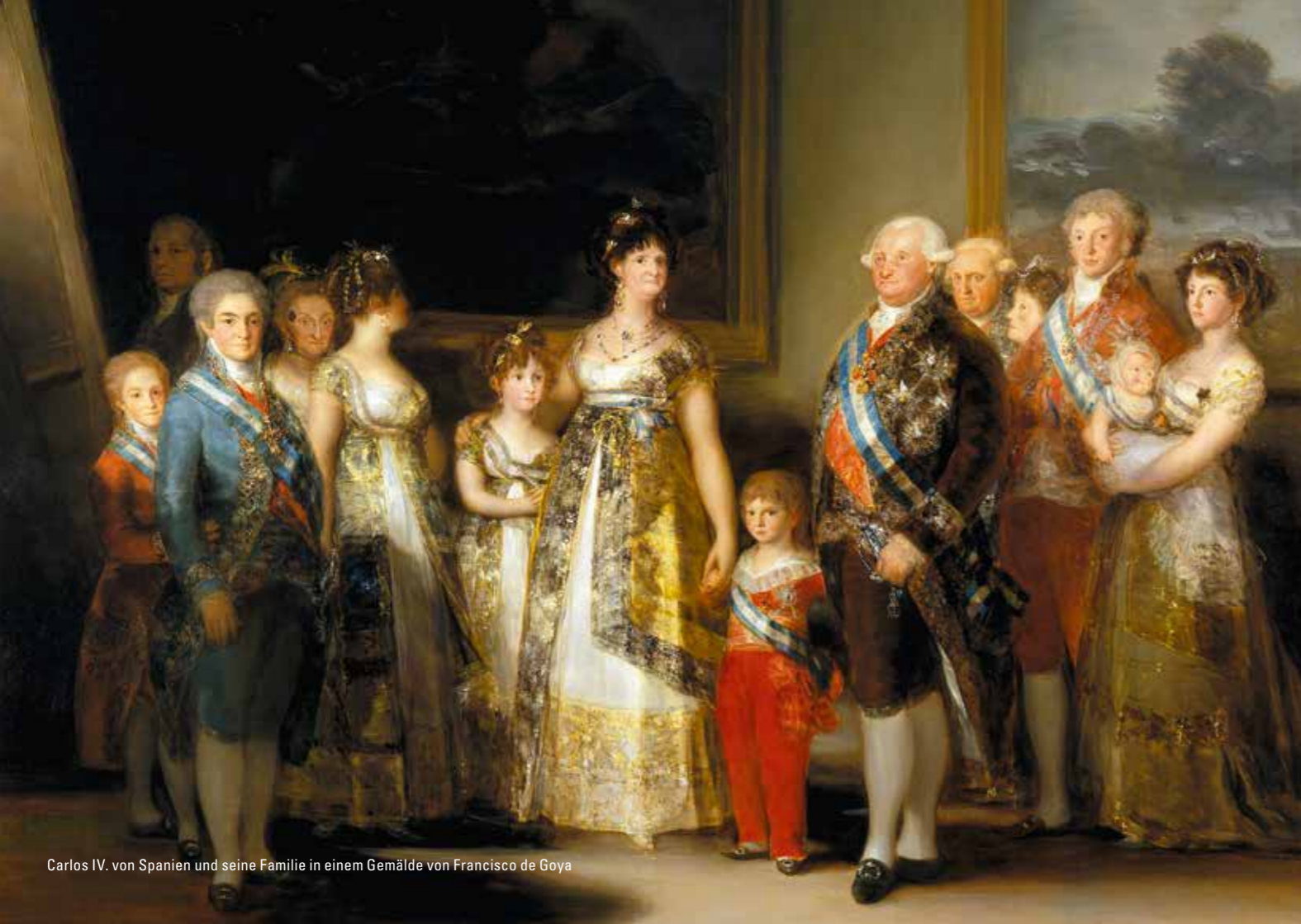
Carlos IV. von Spanien und seine Familie in einem Gemälde von Francisco de Goya