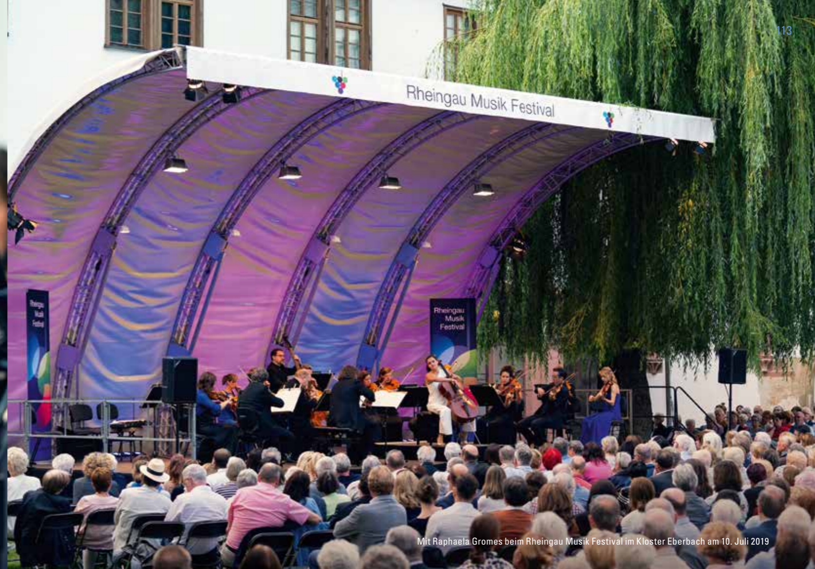
Mit Raphaela Gromes beim Rheingau Musik Festival im Kloster Eberbach am 10. Juli 2019