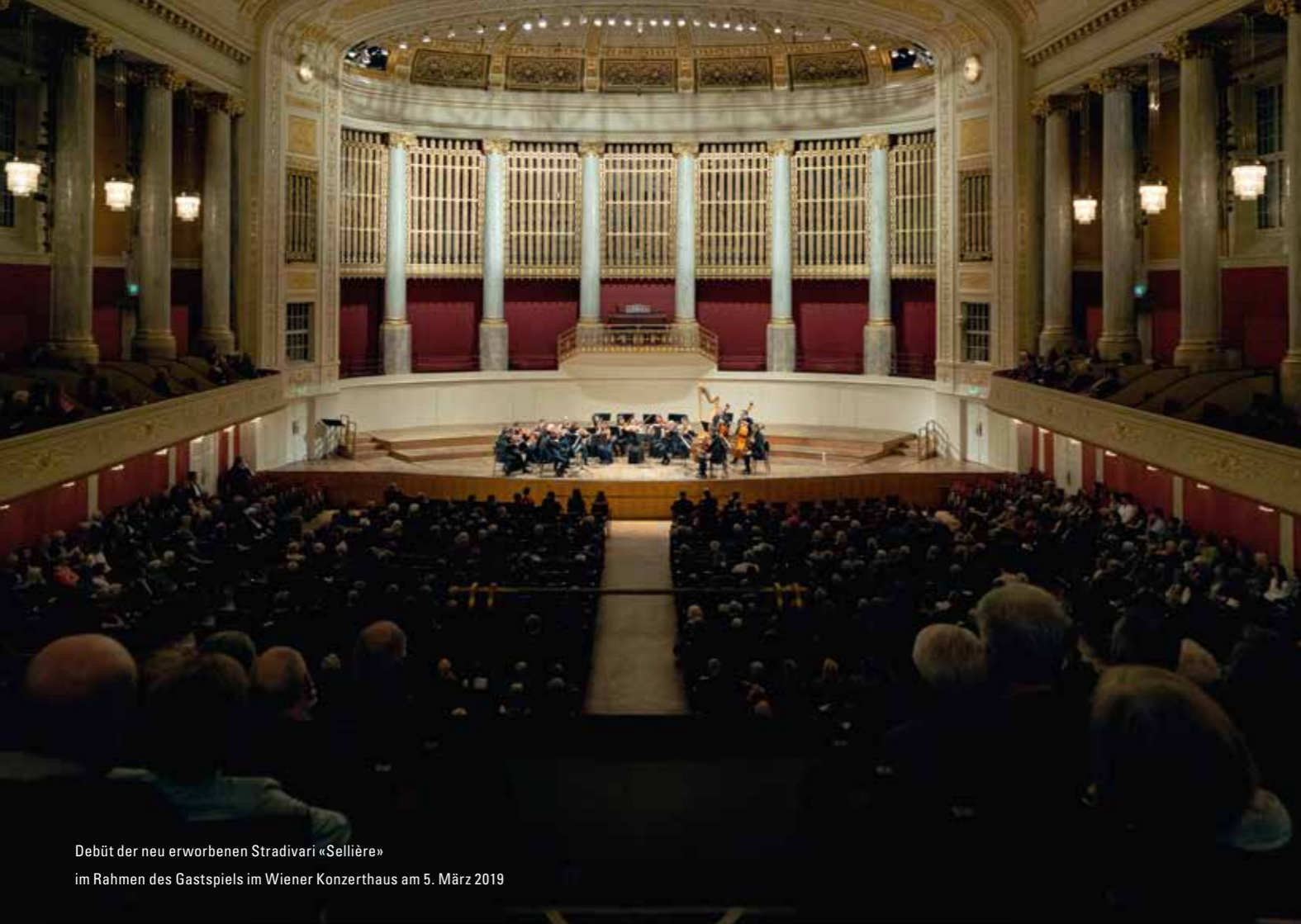
Debüt der neu erworbenen Stradivari «Sellière» im Rahmen des Gastspiels im Wiener Konzerthaus am 5. März 2019