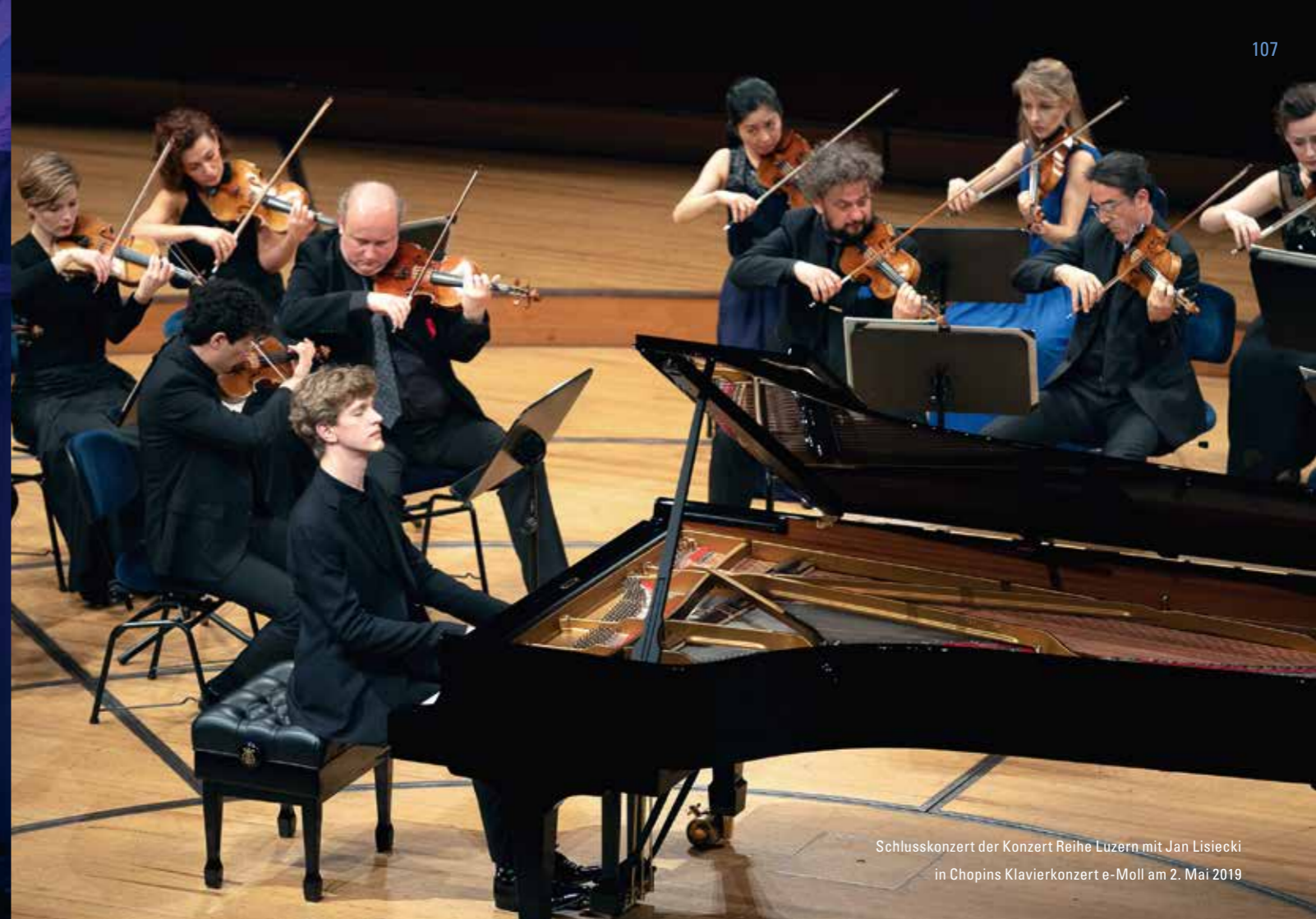
Schlusskonzert der Konzert Reihe Luzern mit Jan Lisiecki in Chopins Klavierkonzert e-Moll am 2. Mai 2019