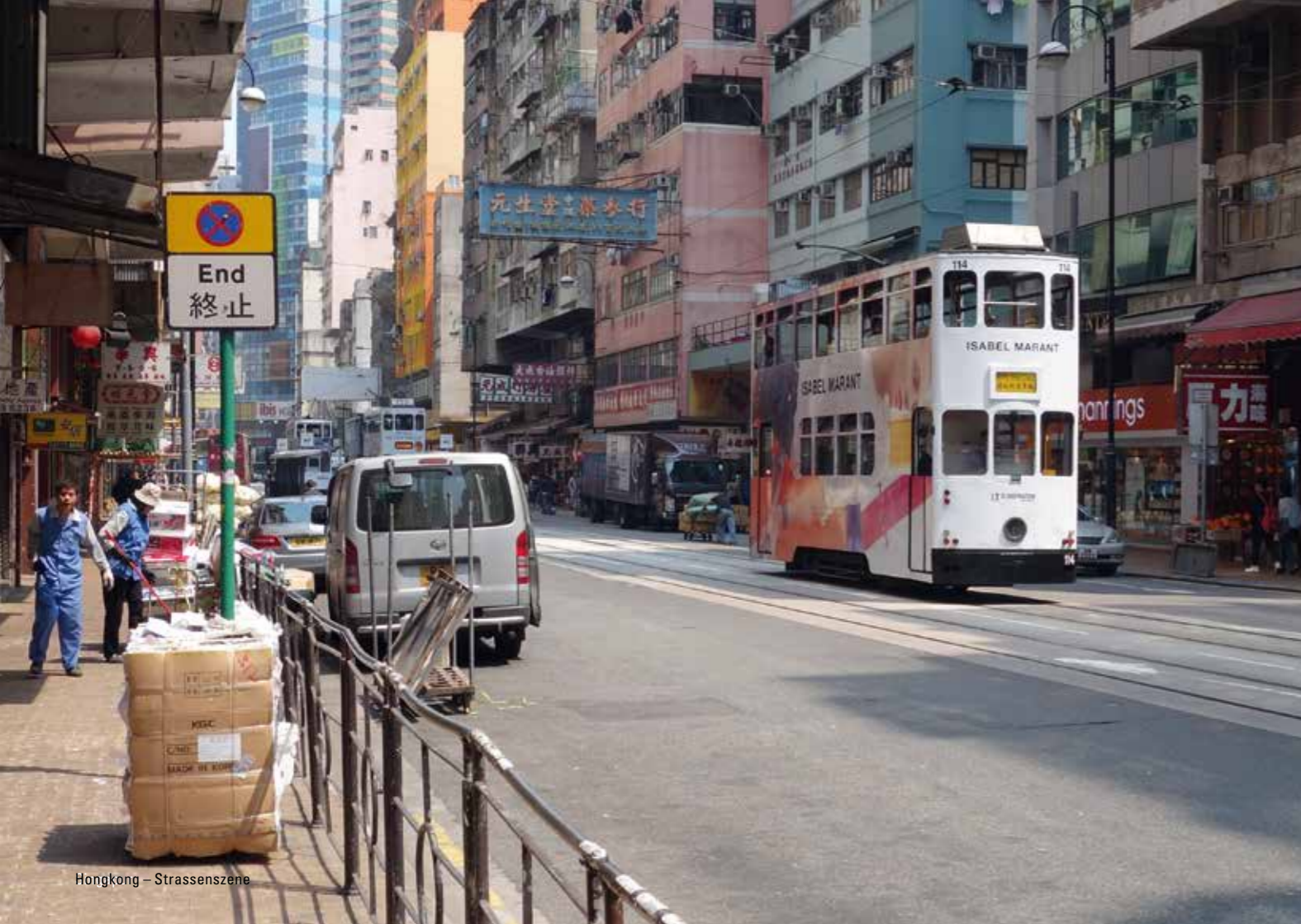
Hongkong – Strassenszene

FR 06.03.2020 19.30 UHR SAFFRON WALDEN, CAMBRIDGESHIRE, SAFFRON HALL