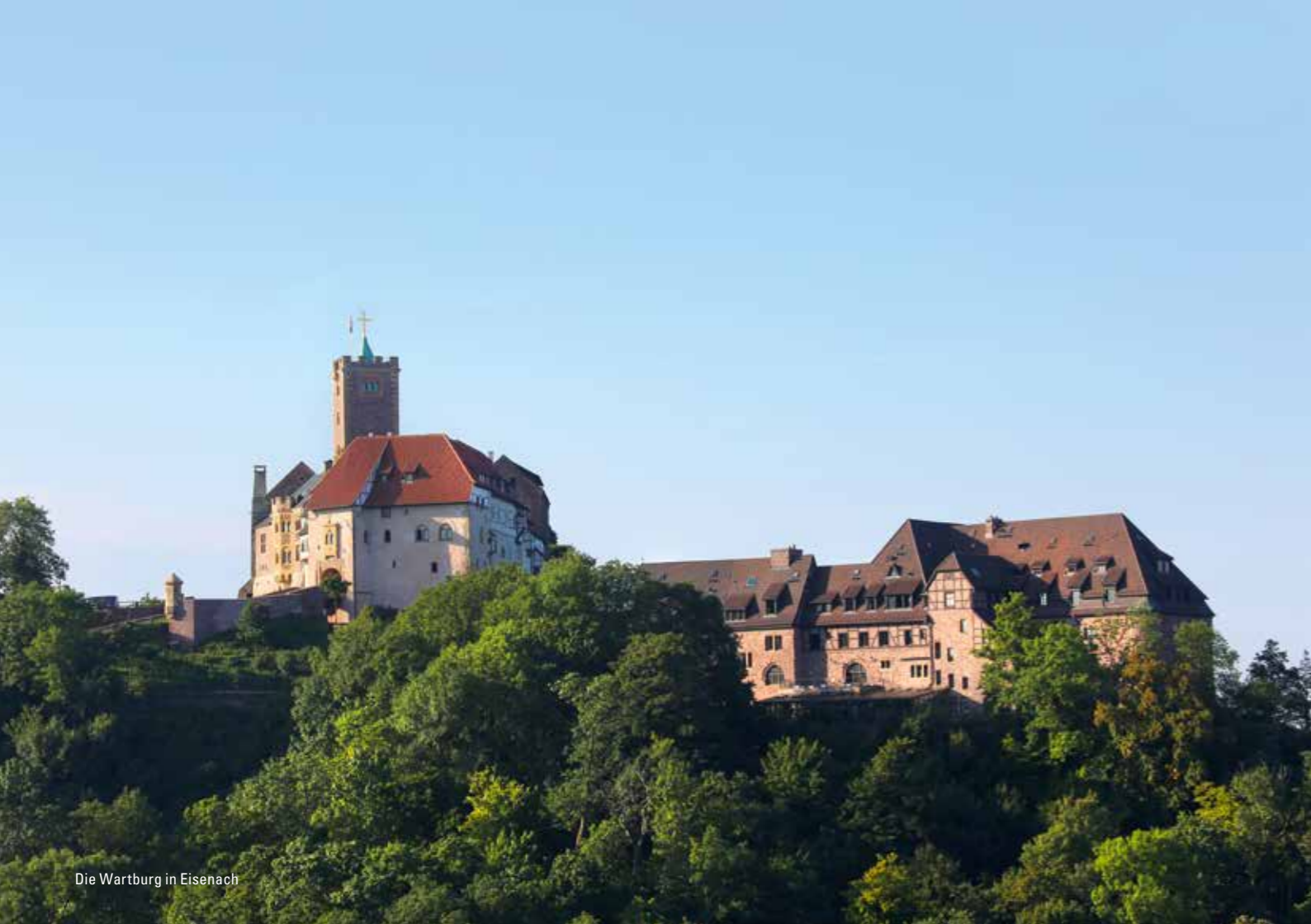
Die Wartburg in Eisenach

DO 14.05.2020 20.00 UHR MÜNCHEN, PRINZREGENTENTHEATER