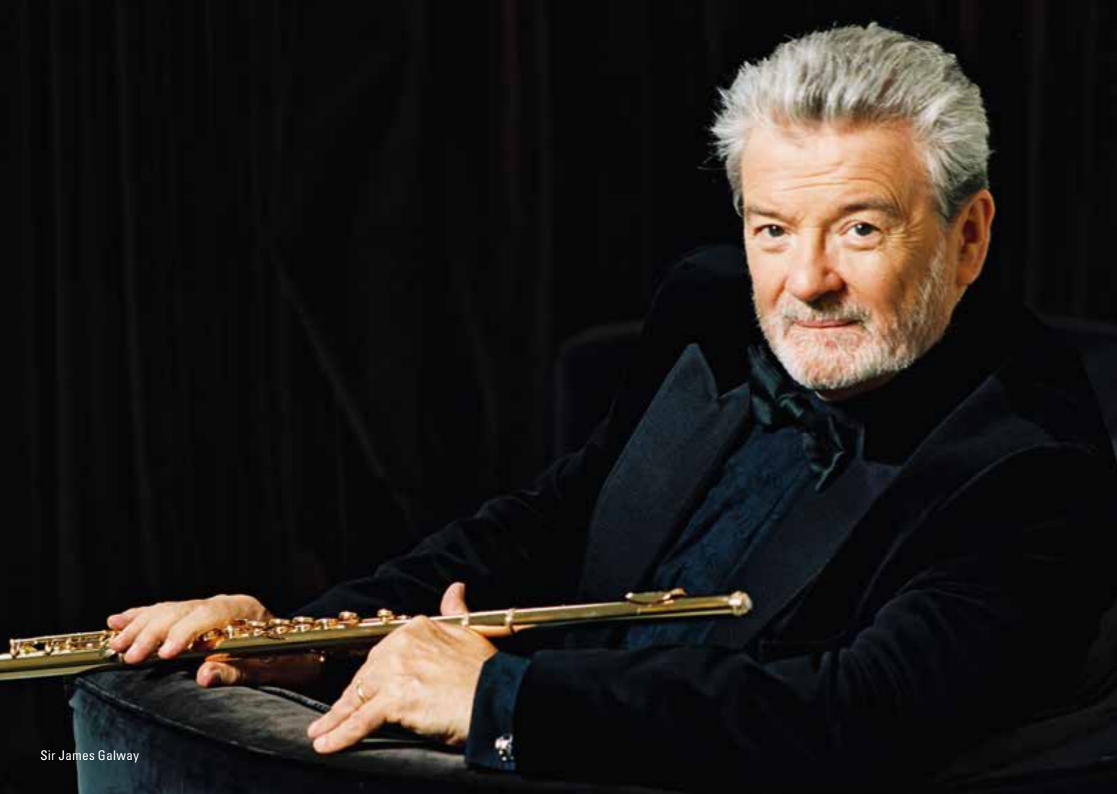
Sir James Galway