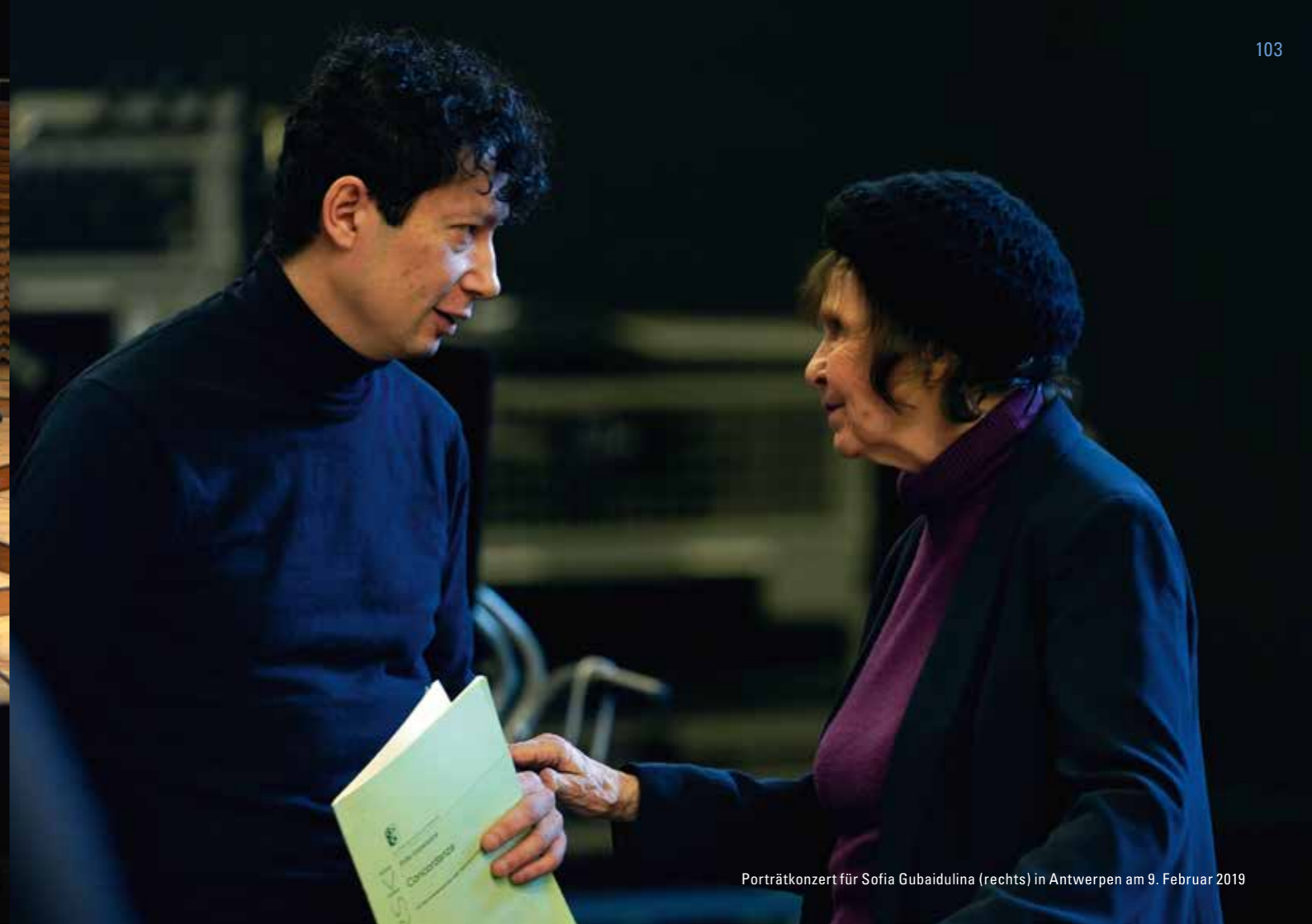
Porträtkonzert für Sofia Gubaidulina (rechts) in Antwerpen am 9. Februar 2019