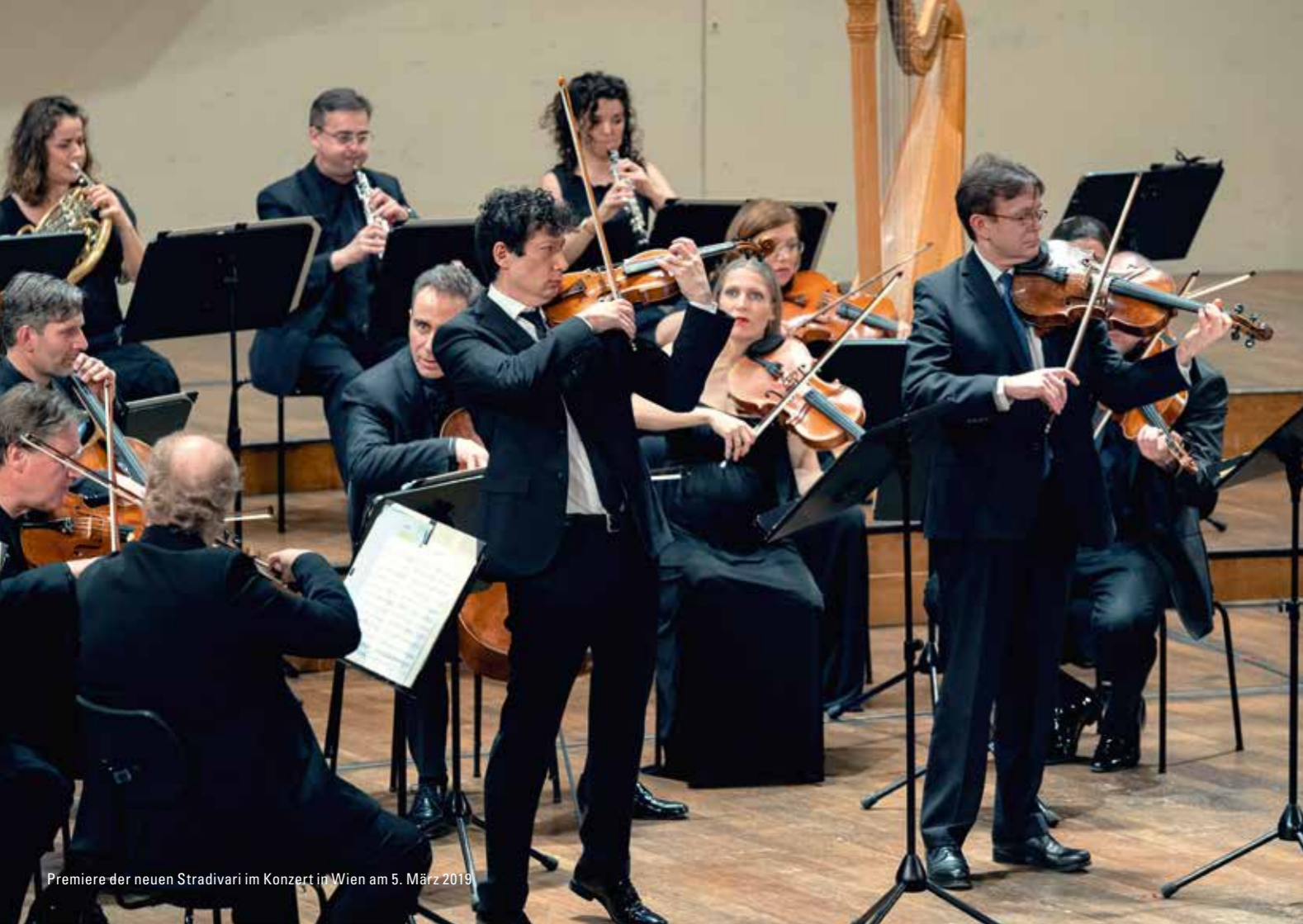
Premiere der neuen Stradivari im Konzert in Wien am 5. März 2019.